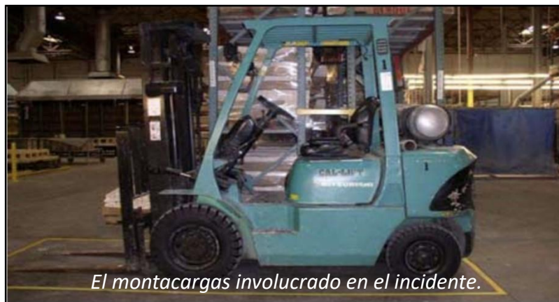
El montacargas involucrado en el incidente.

La investigación reveló que el supervisor si mostró a los trabajadores como cambiar las llantas del montacargas, pero no proporciona entrenamiento apropiado de los riesgos de los rines de piezas múltiples.