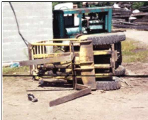
El montacargas involucrado en el incidente.