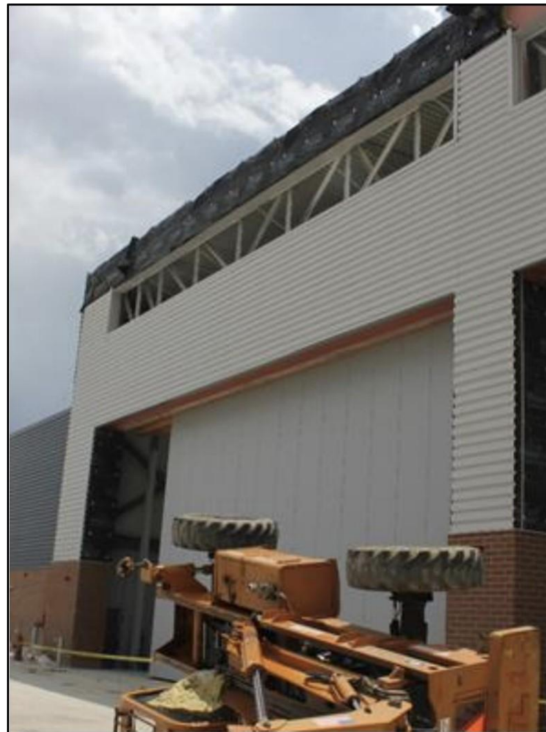
Montacargas volcado en la escena del incidente.