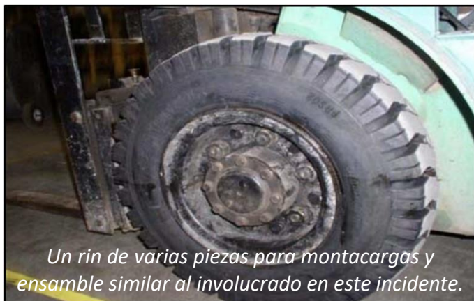
Un rin de varias piezas para montacargas y ensamble similar al involucrado en este incidente.

Mientras dos trabajadores estaban cambiando una llanta ponchada en un montacargas, tomaron un tubo, lo insertaron en la llanta e inflaron parcialmente para redondearla. Tomaron un rin de varias piezas y lo ensamblaron dentro de la llanta. Inflaron completamente el tubo y notaron que estaba pellizcado entre las partes del rin. Mientras uno de los trabajadores de volteo para obtener la herramienta necesaria para desinflar la llanta, el otro trabajador tomo la pistola de impacto de aire y comenzó a desensamblar el rin sin desinflar el tubo. Todos los trabajadores que estaban cerca escucharon la explosión y los paramédicos llegaron rápidamente. La víctima murió por sus lesiones en unos días. Reporte Caso NIOSH California 10CA001